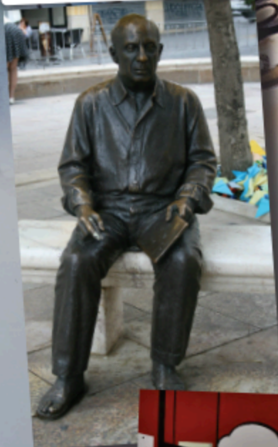
PICASSO SZOBRA SZÜLŐVÁROSÁBAN, MÁLAGÁBAN